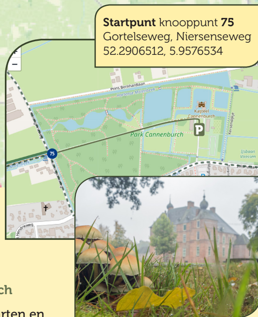
Kasteel Cannenburch Maarten van Rossumplein 4 8171 EB Vaassen

Tip! De kasteelwinkel verkoopt lekkere streekproducten, boeken, kaarten en andere mooie souvenirs. Bij Maarten in het Koetshuis kun je genieten van een hapje en een drankje.