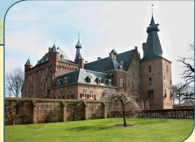
Kasteel Doorwerth Fonteinallée 2b 6865 ND Doorwerth

Stap op je fiets en geniet van de wonderschone omgeving van kasteel Doorwerth met zijn landgoederen, bossen en uiterwaarden van de Rijn. En bezoek na je fietstocht het stoere, middeleeuwse kasteel dat je laat zien hoe vroeger op een landgoed werd geleefd. In de ingerichte vertrekken kun je de vroegere sfeer letterlijk ruiken, zien en horen.