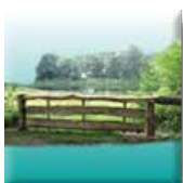
Akkers en weiden aanwezig