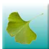
Bijzondere bomen aanwezig